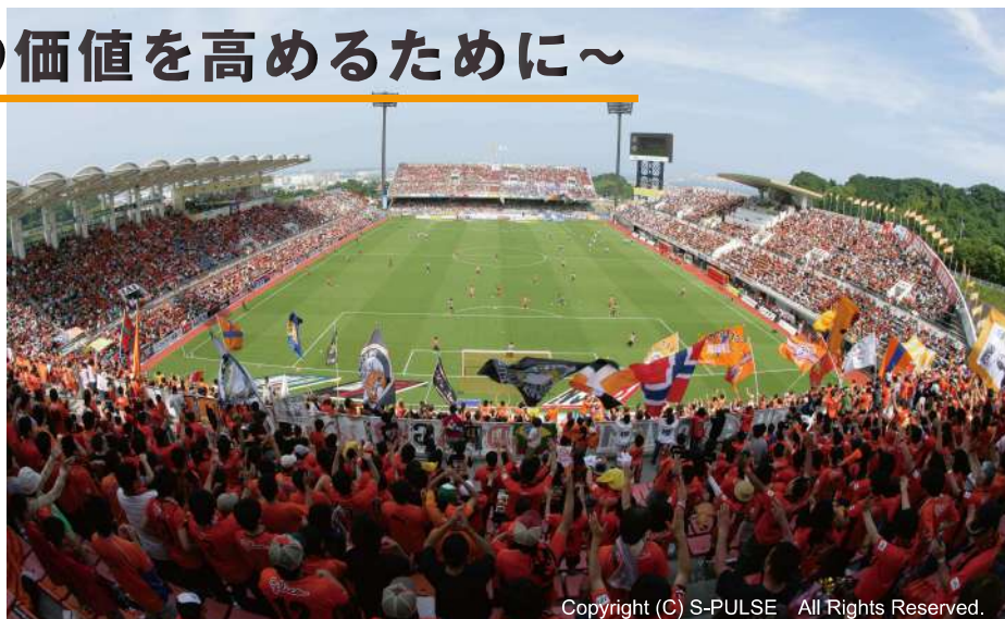
Copyright (C) S-PULSE All Rights Reserved.

静岡県静岡市に本社を持つ株式会社エスパルス様。多くのファンを惹きつけるプロサッカークラブ『清水エスパルス』は、ホームタウンである静岡市から、全国、アジア、世界へ夢と感動を届けています。そんなエスパルス選手達の熱のこもった練習風景や選手・監督のインタビュー、イベント情報などを動画で配信しているWebサイト、ORANGE-TVにららくログ解析をご導入いただいています。その目的と効果、具体的活用方法を直接伺いました。